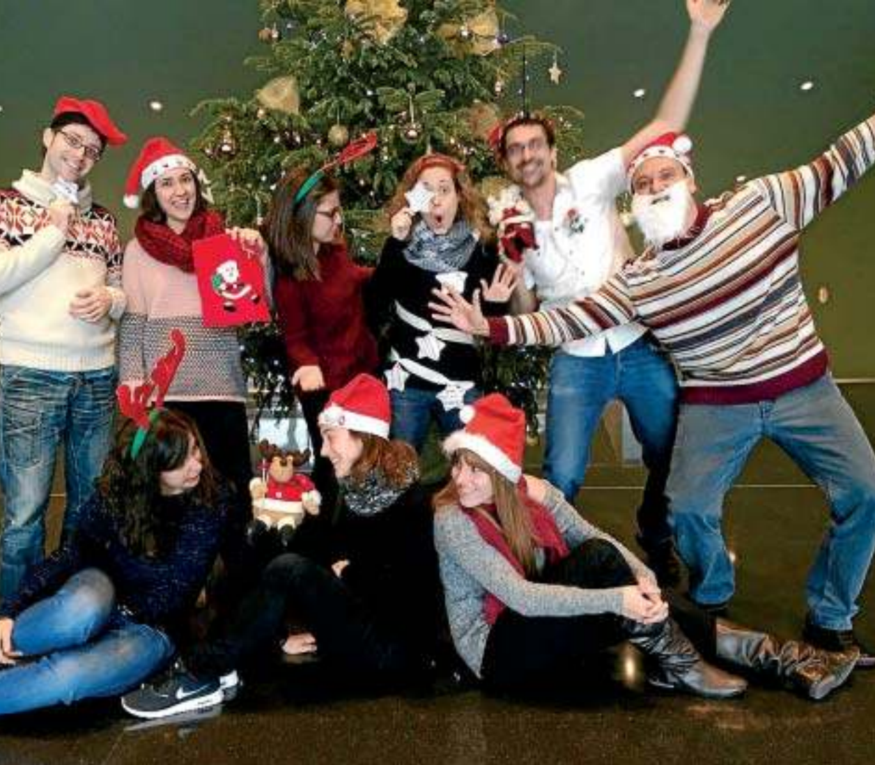
Amics. La felicitació de Nadal de l'any passat mostra l'esperit desenfadat del grup, que són grans músics dalt de l'escenari i grans amics a baix.